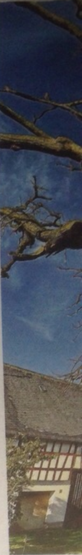
■ Belgeler. Sehtige Eiche ein Wald. Das Alter des Baues den Fall stand er den Hunsrück zo